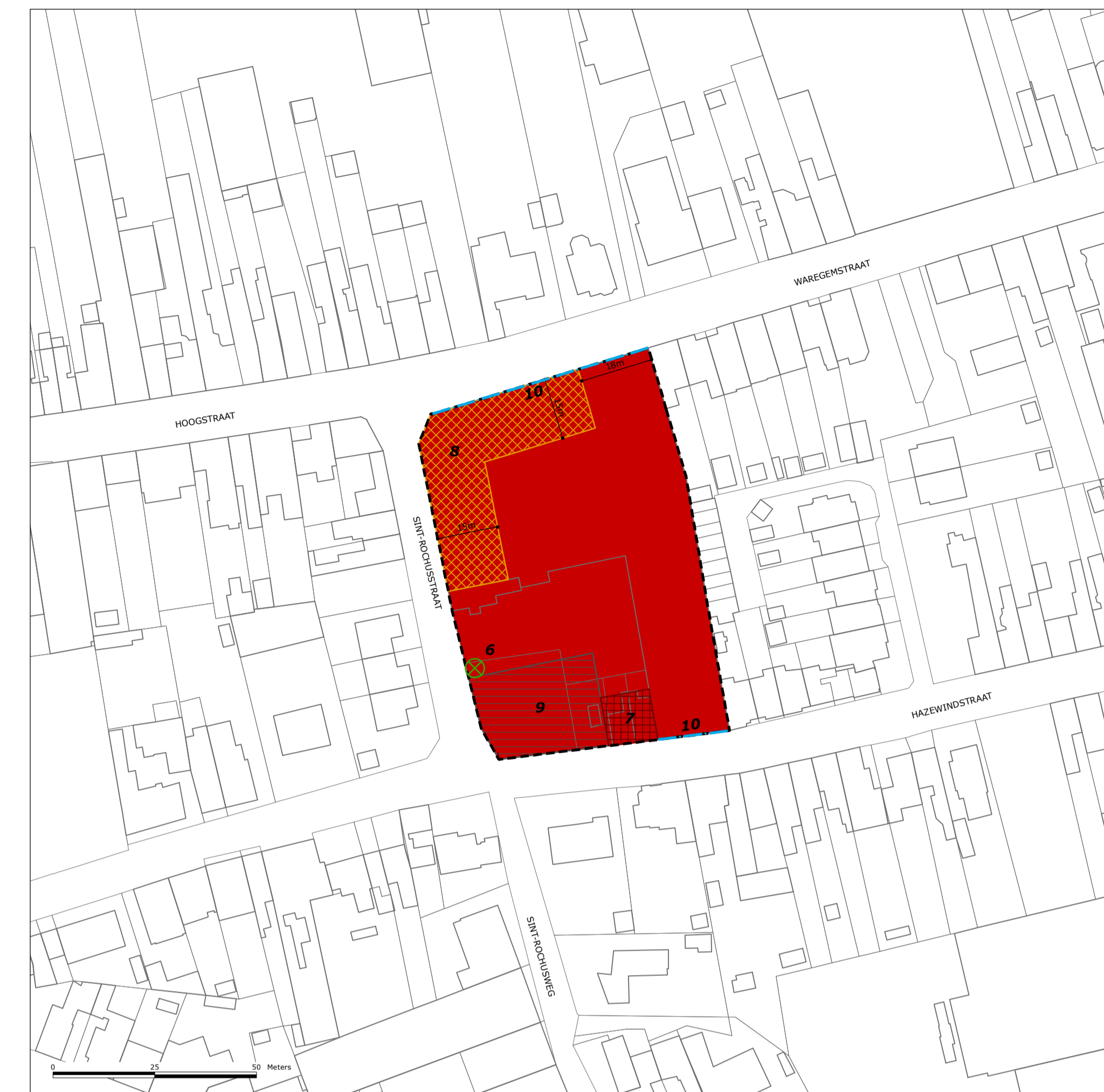
3/ SITE SINT-ROCHUSWEG