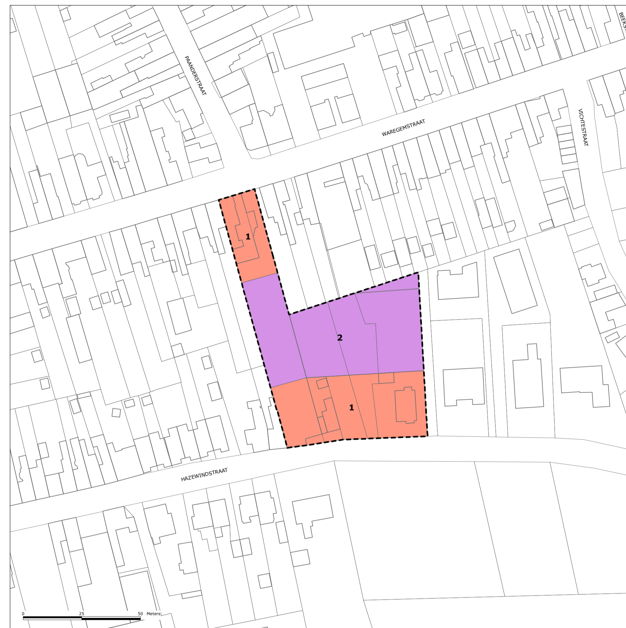
1/ SITE HAZEWINDSTRAAT