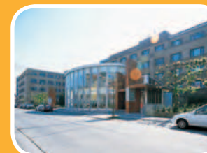
campus loofstraat Loofstraat 43