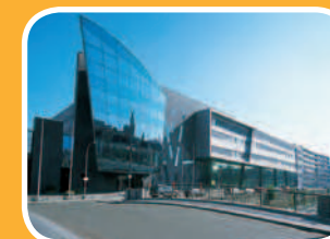
campus reepkaai Reepkaai 4