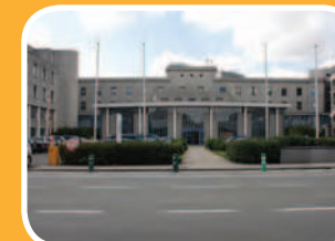
campus verduysselaan Burg. Verduysselaan 5

az groeninge vzw zetel: Pres. Kennedylaan 4 | 8500 Kortrijk t. 056 63 63 63