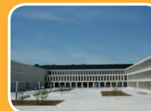
campus kennedylaan Pres. Kennedylaan 4